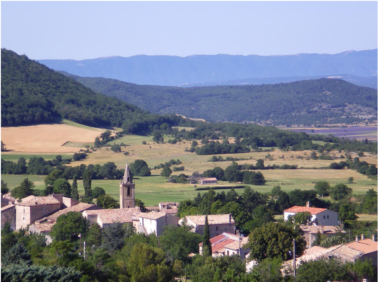
Vue du village de SAUMANE

Département des Alpes de Haute Provence Arrondissement de Forcalquier