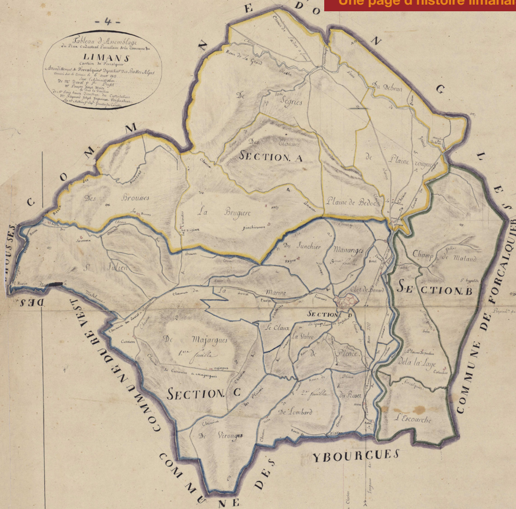
Tableau d'Assemblage du Plan Cadastral Établi sur les Communes de LIMANS Canton de Forcalquier Arrêté du 10 Mars 1808 - N° 115 Loi du 18 Mars 1808 - N° 116 Décret du 25 Mars 1808 - N° 117 Décret du 26 Mars 1808 - N° 118 Décret du 27 Mars 1808 - N° 119 Décret du 28 Mars 1808 - N° 120 Décret du 29 Mars 1808 - N° 121 Décret du 30 Mars 1808 - N° 122 Décret du 31 Mars 1808 - N° 123