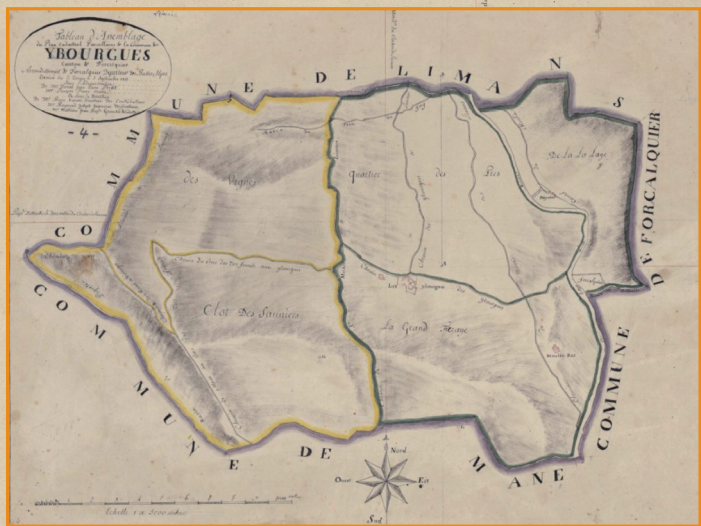
Plan Napoléonien - Archives de Digne - 6 Août 1813